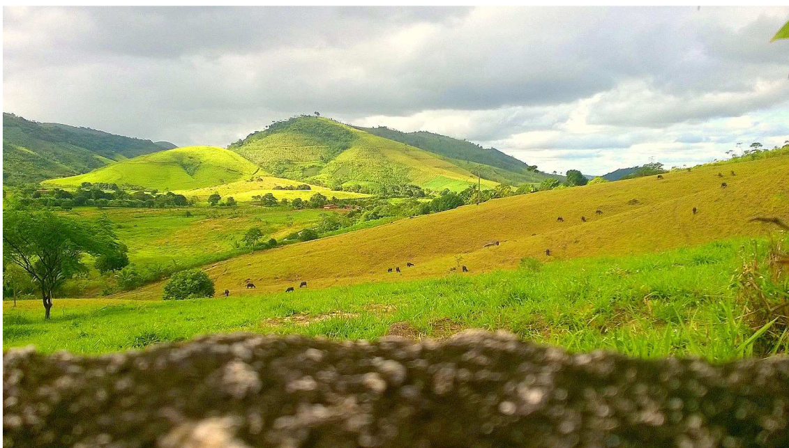
Figura 1. Aspecto da paisagem rural de Ribeirão, Pernambuco Autor: Oliveira Neto, 2016.

Levando em consideração o ponto de partida de Milton Santos sobre a análise do espaço como “[...] conjunto indissociável de sistema de objetos, naturais ou fabricados e de sistema de ações deliberados ou não” (SANTOS, 1994, p. 49). Os recursos naturais como o solo de massapê, rios e chuvas regulares, foram imprescindíveis para instalação da técnica presente nos engenhos e posteriormente das usinas no município. Tudo isso tornou Ribeirão o um dos maiores produtores de açúcar do estado, e assim como a maior parte dos municípios da zona da mata, altamente dependente da monocultura.