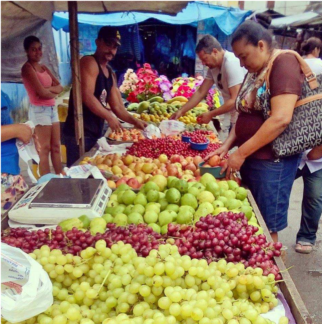
Figura 3. Cena da Feira ao ar livre de Ribeirão, Pernambuco

Os reflexos da monocultura estão presentes na cidade, a falta de estrutura e alternativas econômicas para uma população crescente, aumentam a violência urbana, proliferação de doenças nas periferias as margens dos canais que ainda são queimados na época da moagem.