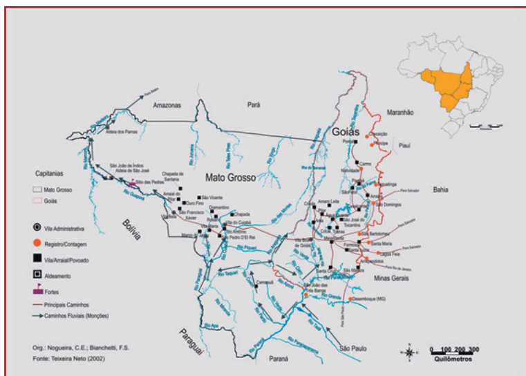
Figura 5: Caminhos e rotas para o Mato Grosso – século XVIII

ao menos para os formuladores de políticas do Conselho Ultramarino, como um imenso “corpo imperial” formado por partes desconexas ao redor do mundo (SOUZA, 2006). Nesse sentido, a posição central de Mato Grosso, cuja rede hidrográfica se comunica, simultaneamente, com as bacias do Amazonas e do Prata, poderia, em tese, possibilitar o trânsito de pessoas e mercadorias entre regiões muitíssimo distantes, solidificando, na América, um território colonial descontínuo, mas unificado.